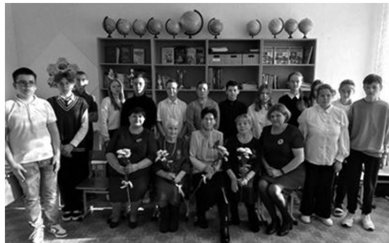
Фото на память.

В 1962 году меня пригласили работать в Киргинскую сельскую школу. Я преподавала биологию и музыку, труд и природоведение, вела активную педагогическую