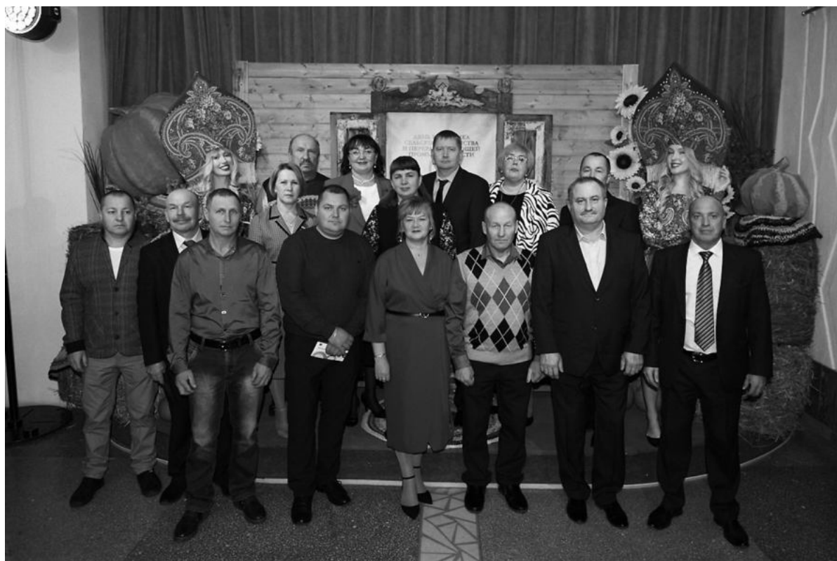
Делегация Ирбитского района.

Лучшим сельхозпредприятием Свердловской области в растениеводстве признан сельскохозяйственный производственный кооператив «Битимский» из городского округа Первоуральск,