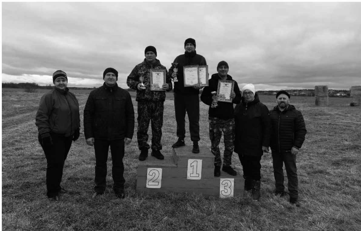
Победители конкурса водительского мастерства.

Победители заездов в ¼ финала вышли в полуфинал, где боролись за право участвовать в финальных заездах. Эмоций болельщики не скрывали, победителя каждого заезда встречали аплодисментами. К слову, уже с квалификации уверено в лиде-