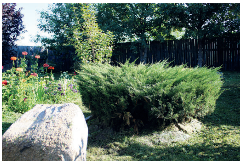
«Двор образцового содержания» семьи ИВАНОВЫХ.