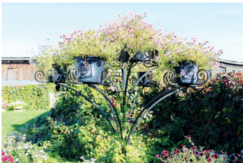
Прекрасный двор семьи СОСНОВСКИХ.