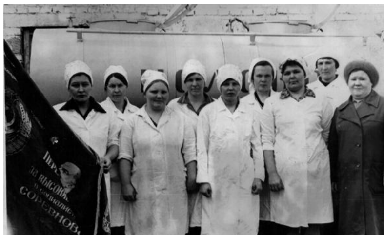
Доярки Гаевской молочно-товарной фермы птицевозова «Ирбитский», 1983-1984 гг.

Обработка будет проводиться в районе с. Ницинского, с. Волково. Работы будут проводиться в период с 3.09.2024 г. по 20.09.2024 г. Пестициды содержат следующие действующие вещества: дикват дибромид - класс опасности для пчел: 3 (МАЛООПАСНЫЕ), класс опасности для человека: 3 (УМЕРЕННО ОПАСНЫЕ).