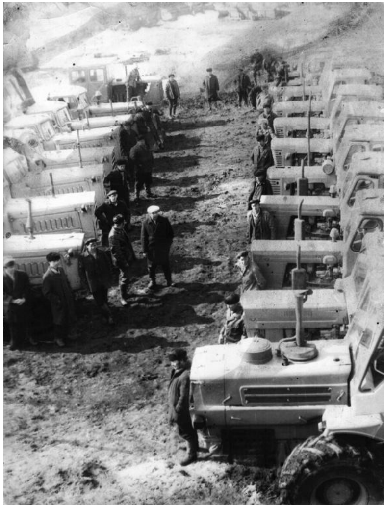
Сельхозтехника Гаевской МТМ 1977-1979 гг.

Ветераны совхоза «Ирбитский» пгт Пионерского и д. Гаевой