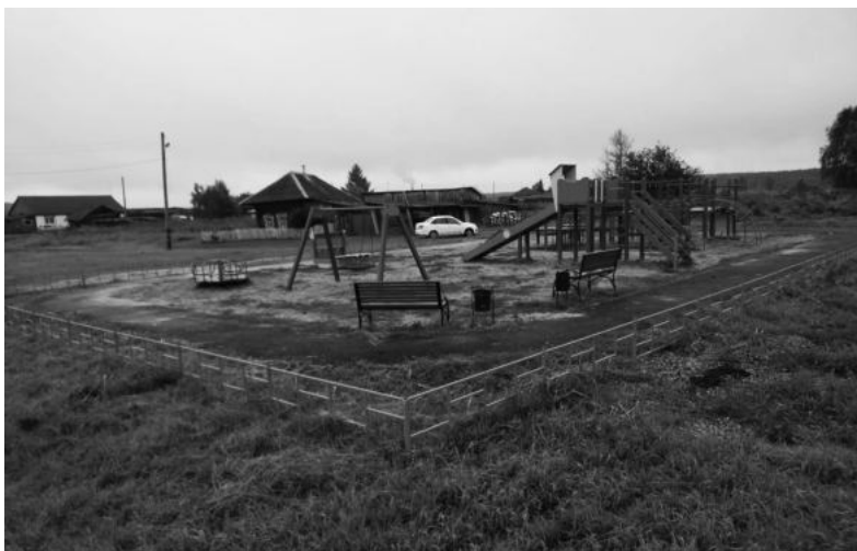
Детская площадка в Мостовой.

Ирбитский район заявку на участие в этой программе впервые подал в прошлом году. В феврале 2023 года администрация муниципалитета утвердила список объектов благоустройства и подала заявку в Минэко-