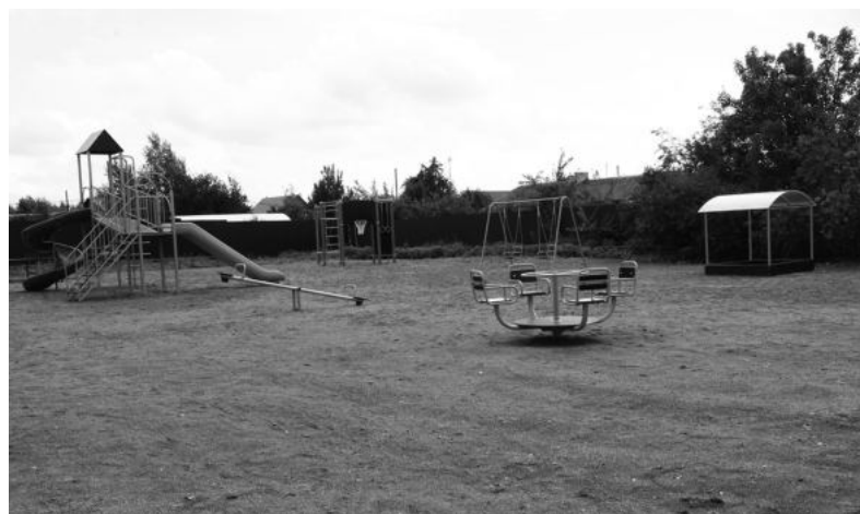
Детская площадка на улице Уральской Пионерского поселка.