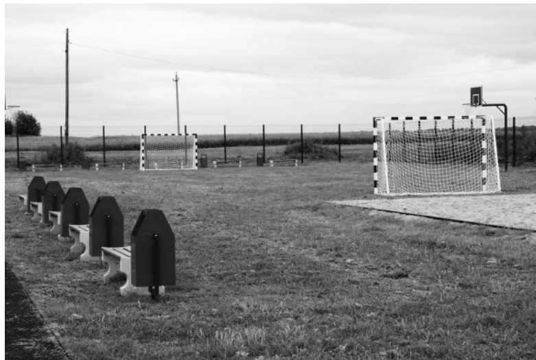
Стадион в Черноорицком.

стадиона в Черноорицком потребовалось два миллиона девятьсот тысяч рублей. В этот проект вложились жители села (1% от стоимости), СПК «Килачевский» (21,8% от стоимости проекта), местный и областной бюджеты.