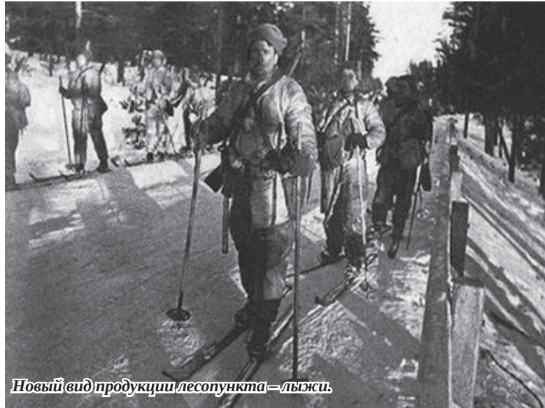
Новый вид продукции лесопункта — лыжи.