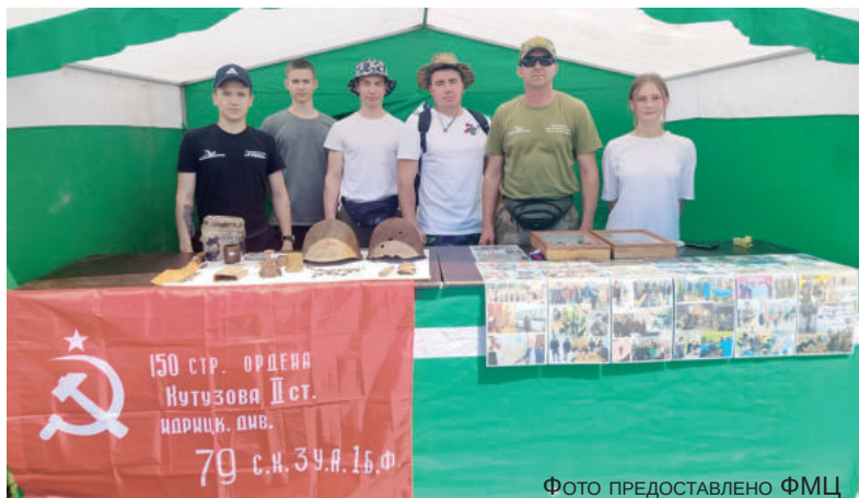
Поисковые отряды Ирбитского района на празднике представили экспонаты, привезенные с поисковых работ на тверской земле.

Активисты «Движения Первых» и «Ювенты» вместе с гостями изготовили более ста значков, посвященных юбилею района. Кроме того, ребята подготовили зажигательные флэш-мобы.