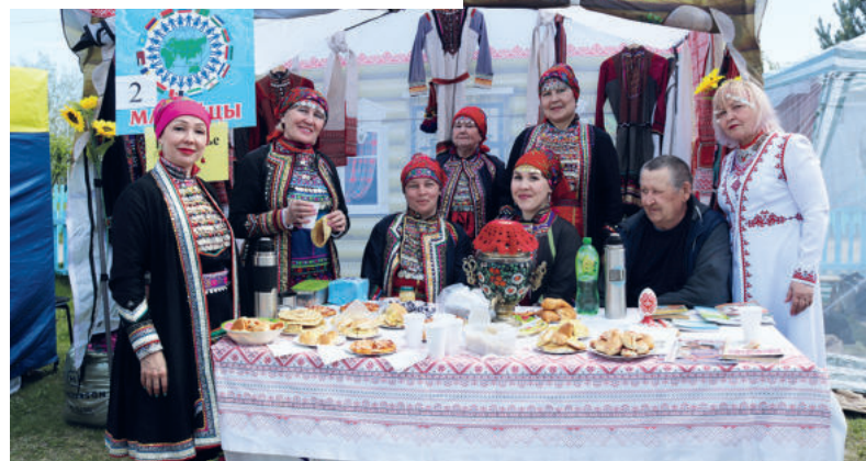
Впервые свое подворье на ницинском «Венке дружбы» представила региональная общественная организация национально-культурная автономия марийцев Свердловской области «Урал Мари».

Большекочёвская сельская библиотека совместно с работниками дома культуры и вокальный коллектив «Селяночка» участвовали в номинации «Национальное подворье» и получили диплом лауреата!