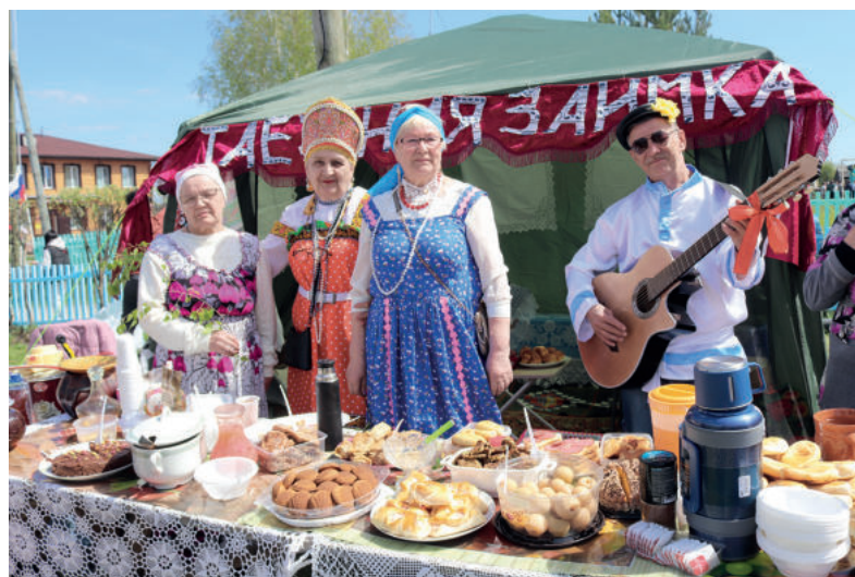
Подворье «Таежная заимка» представили участники литературного клуба «Созвездие» из поселка Цементный Невьянского ГО. Впервые на фестивале они побывали в прошлом году, в нынешнем году стали обладателями диплома второй степени.