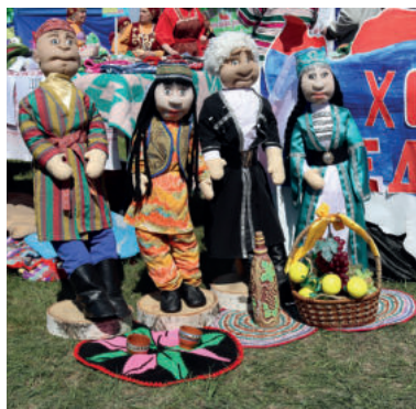
Коллектив рукодельниц «Мастерилки» из села Писанец Артемовского ГО представили на фестивале-конкурсе коллекцию кукол в национальных костюмах «Хоровод единства». Всего мастерицы сшили пять пар кукол в национальных костюмах. Высота каждого изделия ручной работы 70 сантиметров.