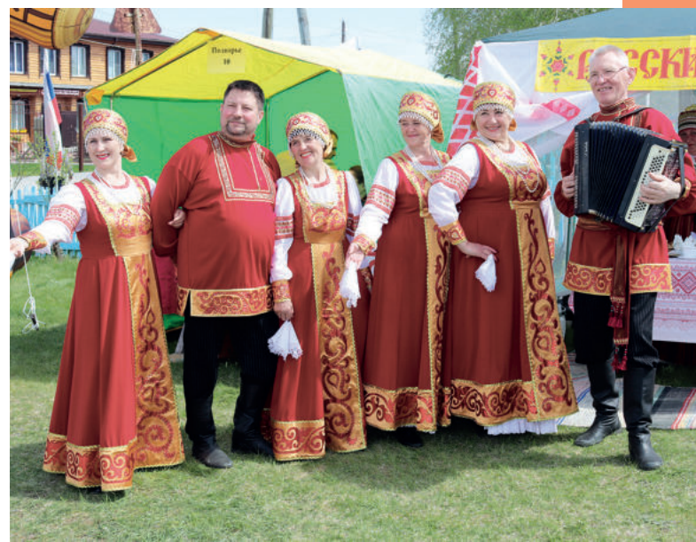
Коллектив Речкаловского СДК встречал гостей и посетителей мероприятия в лучших русских традициях: народными песнями под звуки гармоны. Они знакомили всех с русской чайной церемонией и ее историей.

Участники от Дубского СДК представили зрителям и гостям фестиваля национальные русские блюда.