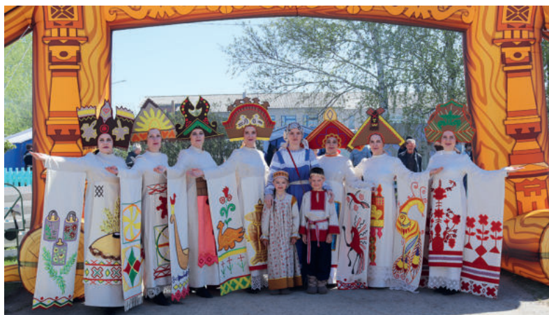
Открыл фестиваль «Венок дружбы» театр мод «Вдохновение» Бердюгинского дома культуры со знаменитой коллекцией «Избы», с которой выступал даже в Москве.