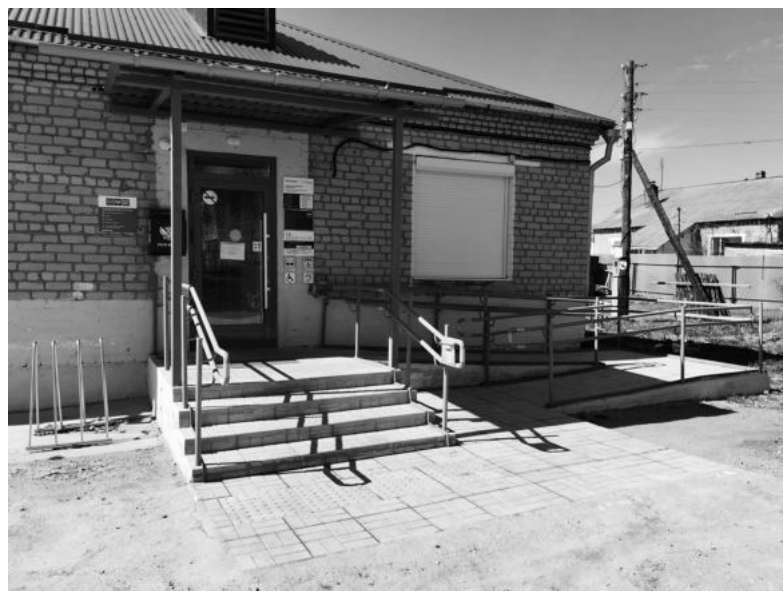
Обновлено и отделение почты.