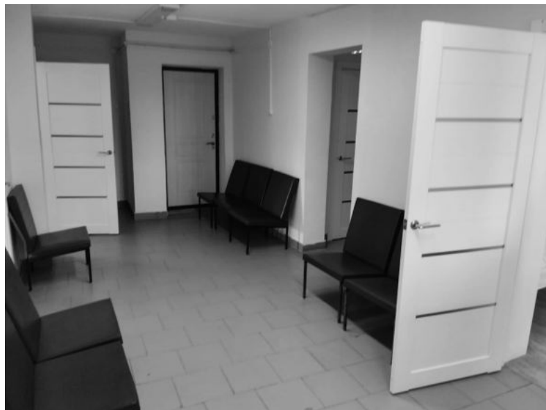
Дубский ФАП после капитального ремонта.