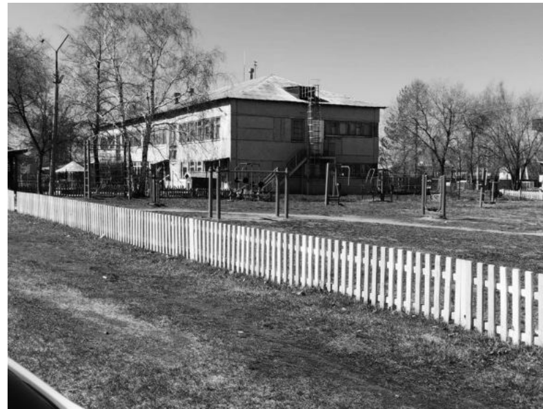
Сегодня в Дубском детском саду функционирует четыре группы для 56 ребят.