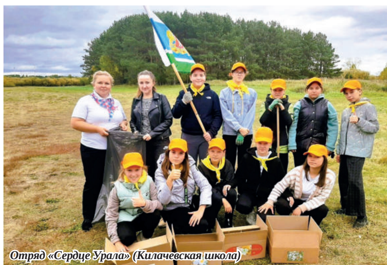
Отряд «Сердце Урала» (Килачевская школа)

Почти в каждом отряде есть такой волонтер, который всегда первый участвует во всех конкурсах и акциях, сам предлагает идеи и