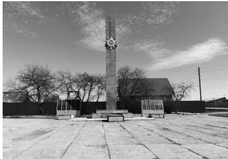
В нынешнем году перед домом культуры отремонтируют обелиск, посвященный памяти участников Великой Отечественной войны.

- Основная проблема нашей территории – дороги. Их состояние оставляет желать лучшего, тем более школьный автобус ежедневно подвозит 35 ребят из шести населенных пунктов. На балансе территориальной администрации 44,5 километра проселочных дорог. Грейдируем и щебениваем дороги по мере финансовых возможностей. В прошлом году щебенили дорогу по улице Еланской в Дубской на 990 тысяч рублей и дорогу от трассы Ирбит-Дубская до переулочка деревни Лихановой на 810 тысяч рублей. Еще на 348 тысяч рублей провели грейдирование участков дорог в наших деревнях. Щебенку подсыпали в Гунях, Бархатах и немного в Дубской в 2016 году. Сегодня эти участки уже снова требуют обновления. В прошлом году была отремонтирована центральная дорога от Ирбита до Юдиной через Дубскую. К ней мы не имеем никакого отношения, она находится на региональном балансе, но ремонту, конечно, рады.