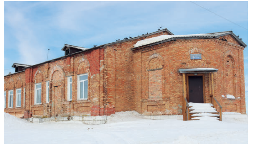
Здание Большекочевской школы изначально строилось как церковь. Строили ее всем миром, но не успела церковь открыть свои двери. После революции здание было отдано под школу.