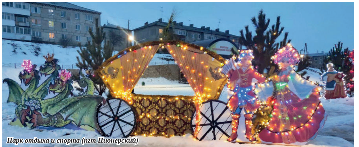
Парк отдыха и спорта (пгт Пионерский)

Зайково, Якшина, Черноричкое, Бердюгина, Чащина, Кирга, Килачевское, Мостовая, Стриганское, Белослудское, Пионерский, Фомина – география участников