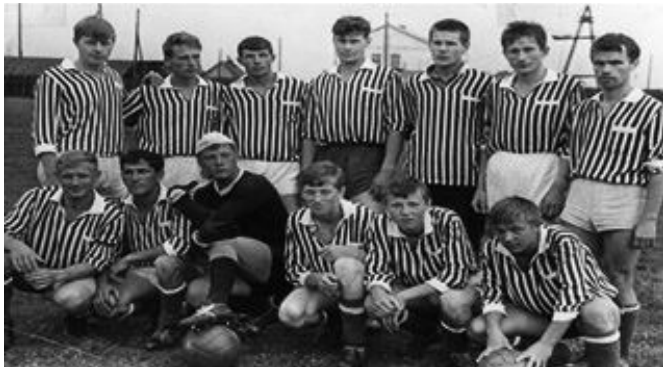
Скородумцы - чемпионы области по футболу (1966 г.).