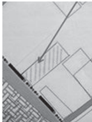
зайства в аренду:

ТОЛЬКО КАЧЕСТВЕННЫЕ ОКНА БАЛКОНЫ УДОБНЫЙ КРЕДИТ БЕСПРОЦЕНТНАЯ РАССРОЧКА СКИДКИ ПЕНСИОНЕРАМ скидки до 50% магазин "ОКНА&ДВЕРИ" ТЦ Шоколад, ул. Советская 94 (34355)69-210 тел: 89021569210