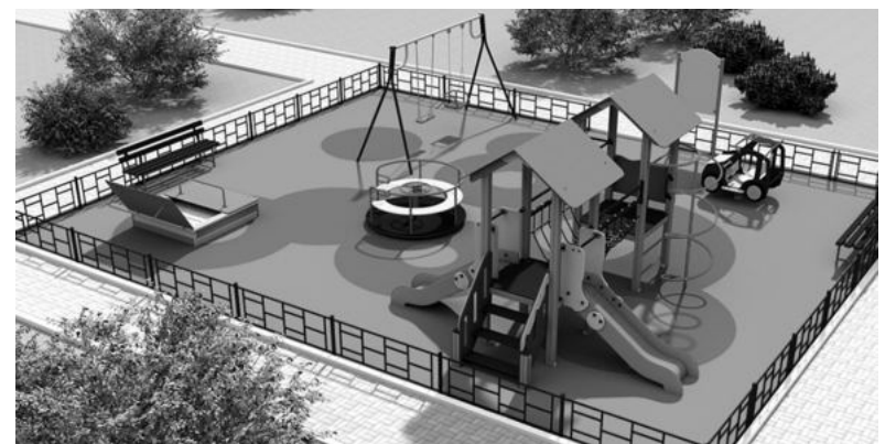
Дизайн-проект благоустройства общественной территории в д. Мордяшиха.

- Жителям деревни очень нужна детская площадка. У наших детей должно быть место, где