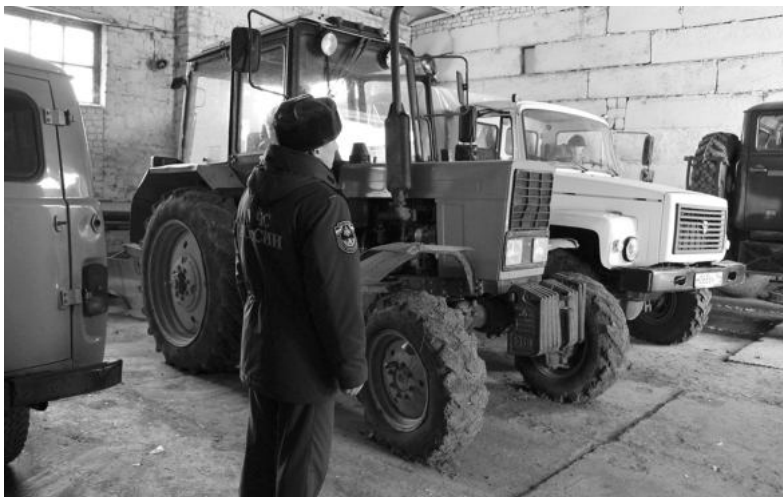
Техника Ирбитского участка уральской авиабазы.

- У нас все готово. Техника основная тоже готова. В арсенале