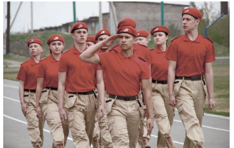
На районном смотре-конкурсе строя и песни.

Очередное посвящение «киргинских соколов» в ряды юнармейцев состоялось 13 декабря. Мероприятие прошло в местном доме культуры. Поздравили ше-