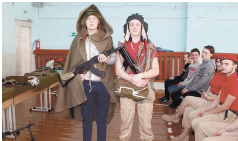
Юнармейцы частенько делятся своим опытом с одноклассниками и младшими школьниками.

Юнармейцы бойко стреляют из пневматических винтовок. Девчонки порой в цели попадают точнее. Еще киргинские соколы ловко собирают и разбирают макеты ав-