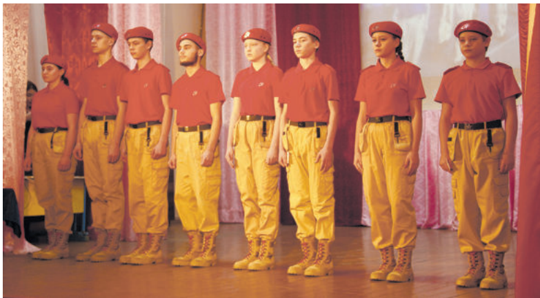
13 декабря три девчонки и три мальчишки присягнули на верность юнармейскому братству.

ки и куртки - притягивают взгляды даже самых равнодушных. Есть у юнармейцев и свое знамя: красное полотнище с символикой юнармии. Всю атрибутику и дорогостоящую парадную форму закупил физкультурно-молодежный центр. Учреждение приобрело для клуба макет автомата, магазины для патронов, стенд для стрельбы, общевойсковой защитный комплект, пневматические винтовки и другое.