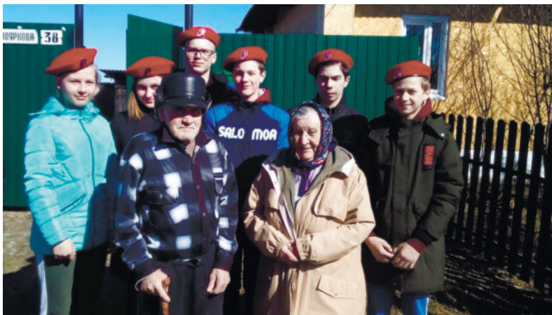
«Киргинские соколы» каждую весну помогают пожилым людям навести порядок на придомовой территории.

Пройти мимо юнармейца, не заметив его, невозможно. Яркая единая форма с символикой: красные берет и футболка-поло, бежевые берцы, брюки, толстов-