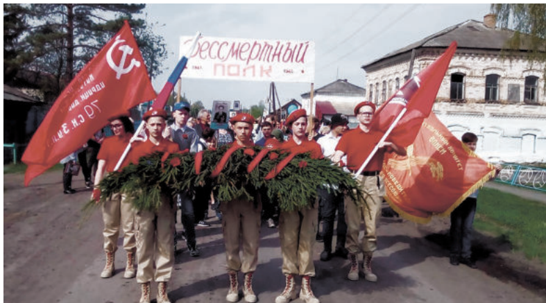
Юнармейцы участвуют во всех мероприятиях, посвященных памятным датам и государственным праздникам.

Впервые клятву юнармейцев киргинские ребята произнесли в феврале 2019 года. Тогда « быть верным своему Отечеству и юнармейскому братству » поклялись девять мальчишек и девчонок - учеников 5-10 классов. Сегодня состав отряда обновился почти на треть: часть ребят окончили школу и выпустились из клуба, поэтому в ряды юнармейцев влились новобранцы.