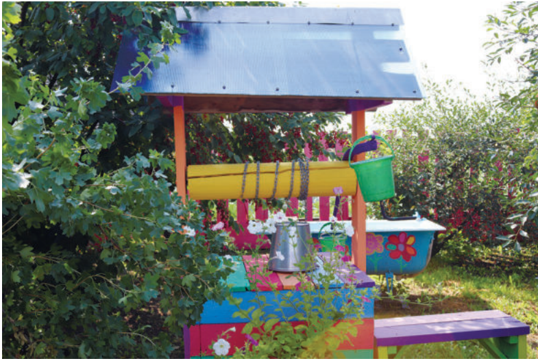
Колодец усадьбы Устиновых

ют пейзаж – хвойные деревья, из которых Гоголевы высадили небольшую аллею, благо площадь участка позволяет фантазии разгуляться.