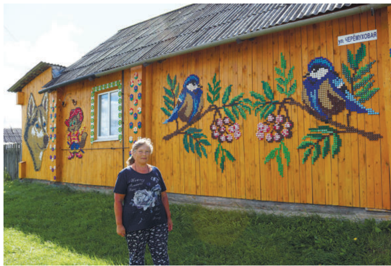
Фасад дома четы Загоскиных