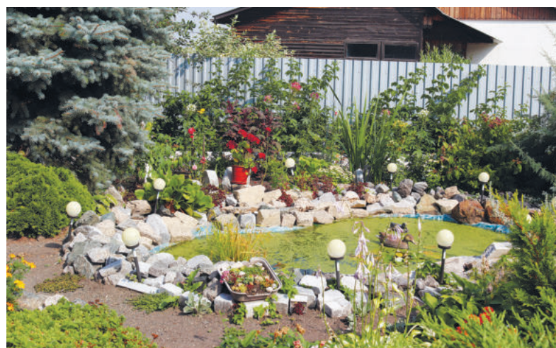
Искусственный водоем Галины Чувашиевой