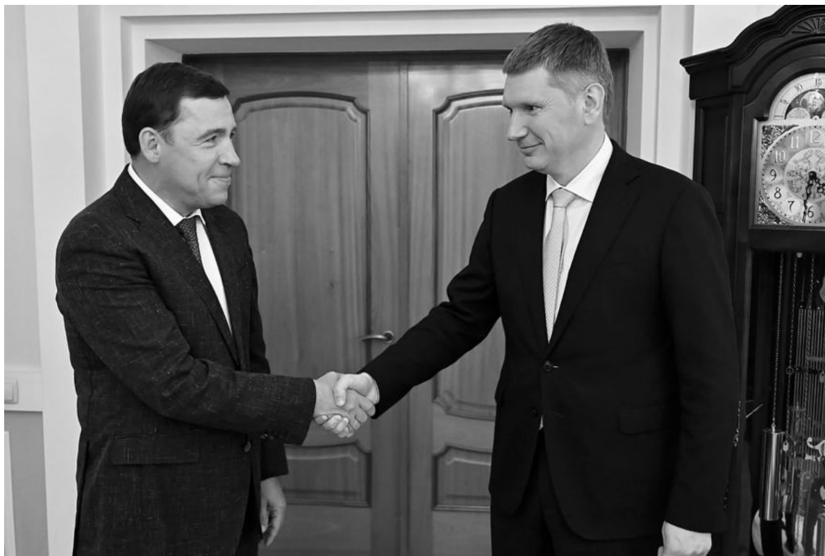
Максим РЕШЕТНИКОВ назвал Средний Урал опорным регионом для экономики страны.

Многие федеральные проекты зависят от того, как будут на местах работать предприятия. И сегодня на предприятиях Свердловской области возможностей больше, чем проблем. Именно так считает министр экономического развития России Максим Решетников , который побывал с рабочим визитом на Среднем Урале. Он рассказал, что следит за ситуацией в регионе со времен, когда сам был губернатором Пермского края, и считает, что у Евгения Куйвашева есть все, чтобы добиться успеха. Интересно, что федеральный министр еще никому публично не выражал такой поддержки. Говорят, Решетников остался очень доволен поездкой на Урал и в неформальной обстановке обещал губернатору продолжать лоббировать интересы региона в Москве.