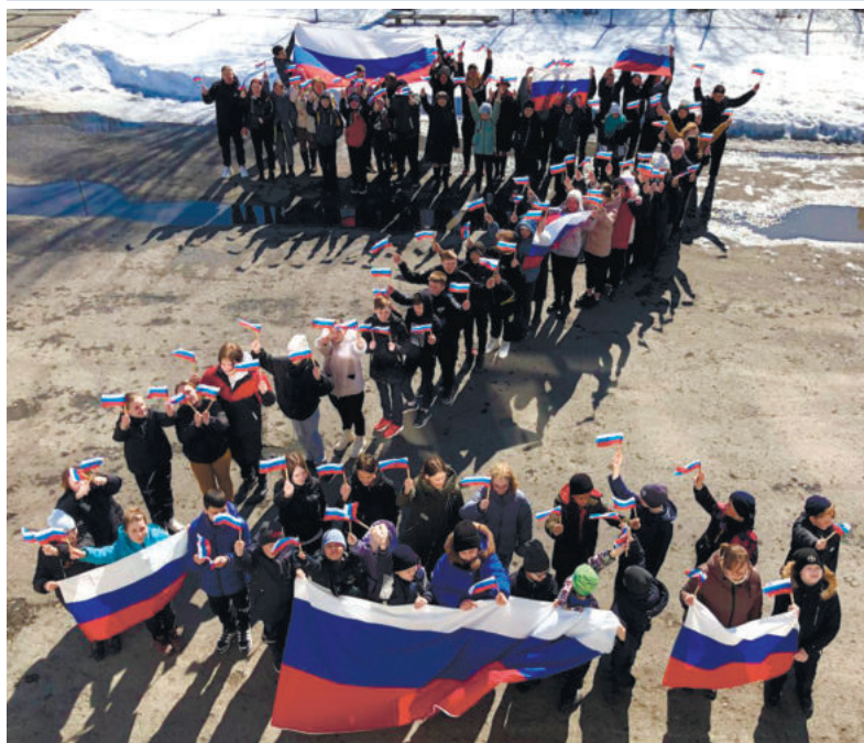
Зайковская школа №2