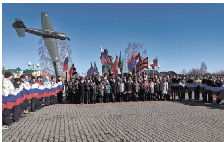
Зайковская территориальная администрация