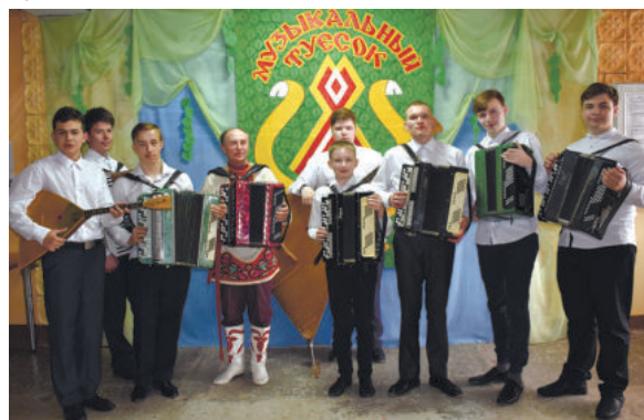
Ансамбль «Гармоника», Зайковский РДК

Уже слышно пение первых прибывших конкурсантов на пока еще пустой сцене Речкаловского сельского дома культуры – распеваются, «пробуют» сцену. Скоро здесь будет очень шумно и зазвучат в полную силу (можно будет услышать звуки) народные инструменты, фольклорные распевы, уверенные голоса солистов и стук каблучков в переплесах-топотушках «расскажет» о самых сокровенных чувствах юных танцоров.