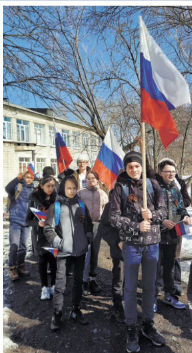
ДУБСКАЯ ТЕРРИТОРИАЛЬНАЯ АДМИНИСТРАЦИЯ

На площадке перед Бердюгинским сельским домом культуры в акции «Своих не бросаем» приняли участие все неравнодушные жители Бердюгинской территориальной администрации. В России проходит масштабная акция «Своих не бросаем» в поддержку Президента РФ В.В. Путина, Вооружённых сил РФ и спецоперации по защите жителей Донбасса. Основная цель акции – поддержать российских военных и показать единство граждан страны. Сейчас во время проведения спецоперации на территории Украины важна поддержка нашим ребятам, которые защищают честь нашей страны.