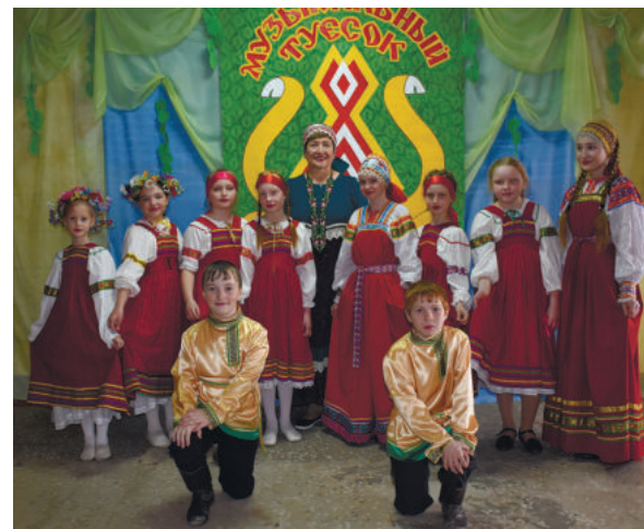
Фольклорный коллектив «Беседушки», Речкаловский СДК