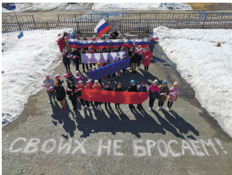
Осинцевская территориальная администрация