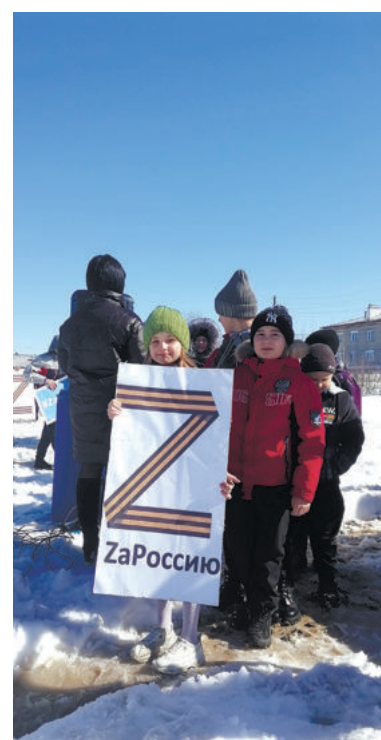
КЛЮЧЕВСКАЯ ТЕРРИТОРИАЛЬНАЯ АДМИНИСТРАЦИЯ