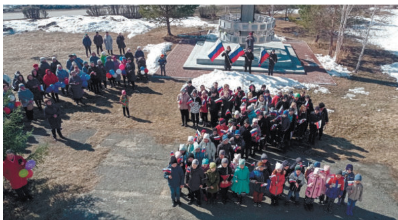
Киргинская территориальная администрация