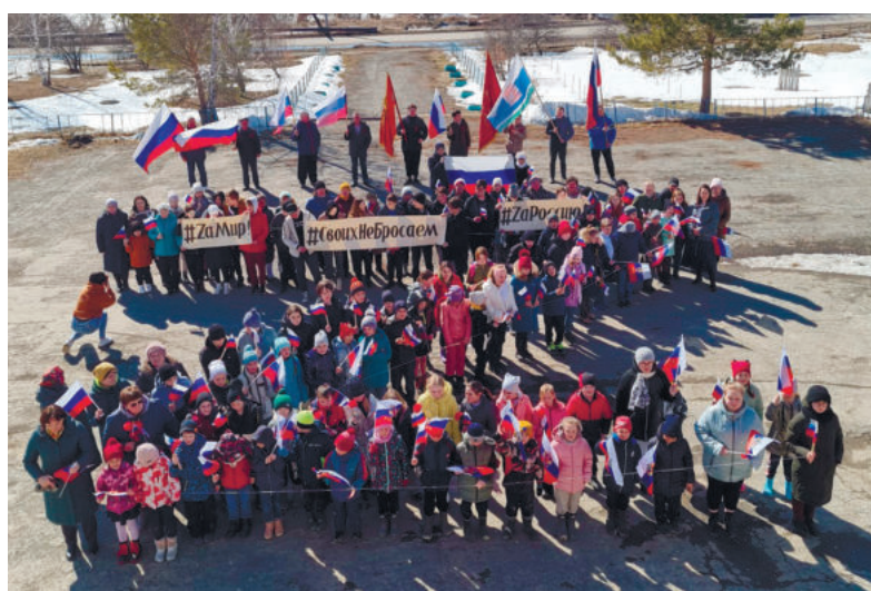
РЕЧКАЛОВСКАЯ ТЕРРИТОРИАЛЬНАЯ АДМИНИСТРАЦИЯ

Подготовила Алена Дудина