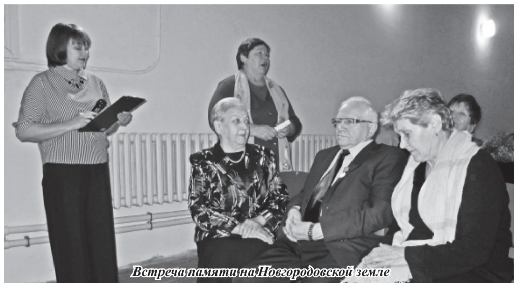
Встреча памяти на Новгородской земле