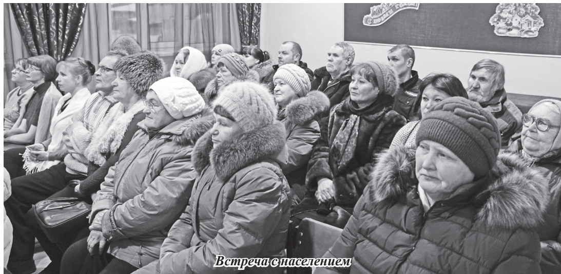
Встреча с населением