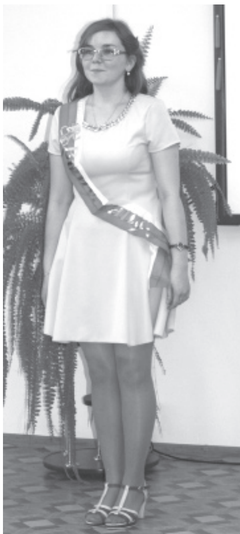
колледжей и техникумов Нижнего Тагила, Камышлова, Екатеринбурга, Ирбита, Красноуфимска и других муниципалитетов.