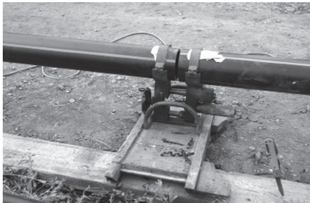
Процесс спайки труб в д. Мельниковой.