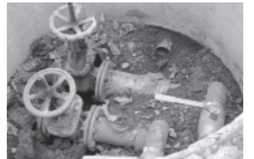
Запорная арматура котельной в п. Пионерском.