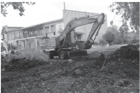
Замена тепловых сетей в д. Новгородовой.