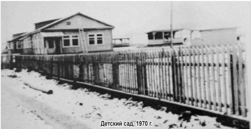
Детский сад, 1970 г.

На заседании уездного Земского собрания от 3 октября 1898 года рассматривался вопрос о приюте, создании яслей. Было решено поручить врачебному совету разработку типа для яслей, доступных населению.