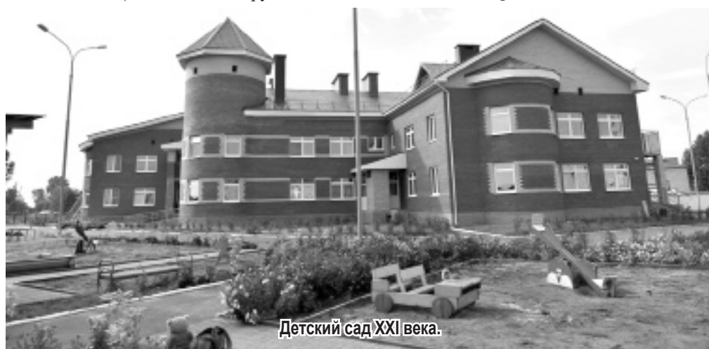
Детский сад XXI века.

С 1920 г. открываются первые детские площадки на летний период для дошкольников в сельской местности, а затем начали организовываться и детские сады (Зайково, Осинцево, Харлово и т.д.), которые вначале занимали площади жилых домов, позже началось строительство проектных зданий. С каждым годом количество функционирующих детских садов и яслей увеличивается, открываются как ведомствен-