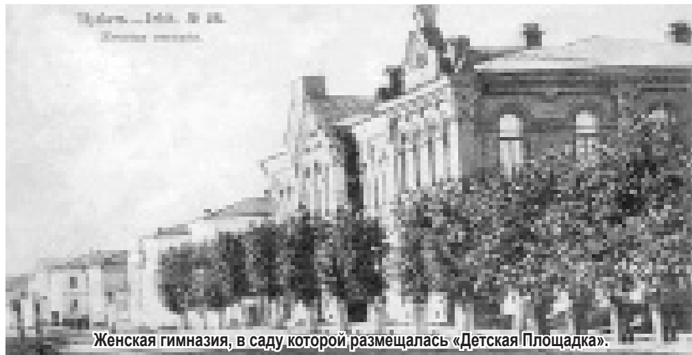
Женская гимназия, в саду которой размещалась «Детская Площадка».

бот. Первый приют был в Верхнеинском. Возраст детей – до 5 лет. Дети проживали от пяти дней и до месяца (в зависимости от их места проживания, т.к. охватывались близлежащие деревни). За детьми присматривали няньки. Приветствовалось, если мать забирала ребенка на ночь домой.