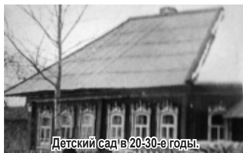
Детский сад в 20-30-е годы.

21 сентября 1900 года на заседании уездного Земского собрания вновь рассматривался вопрос о значении яслей для детей. Все врачи высказывались о том, что ясли нужны повсеместно, т.к. можно ежедневно наблюдать за состоянием здоровья детей и не допустить появления той или иной болезни. Препятствием является поиск удобных помещений, которых не находится в деревнях. На заседании постановили: на содержание отдельных яслей назначить 200 руб. на каждое. Причем определенно