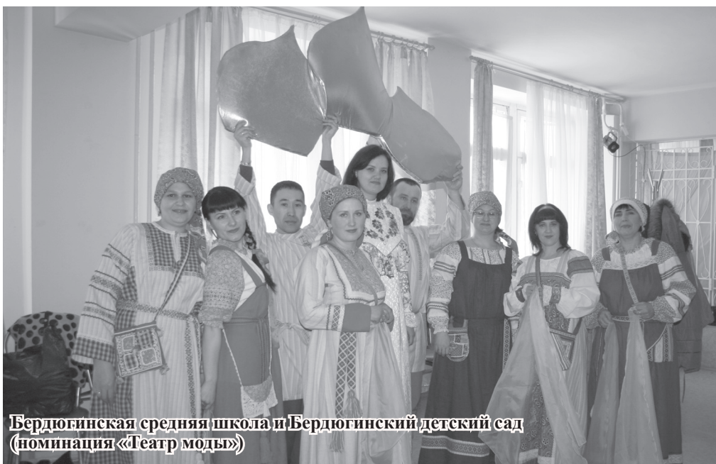
Бердюгинская средняя школа и Бердюгинский детский сад (номинация «Театр моды»)