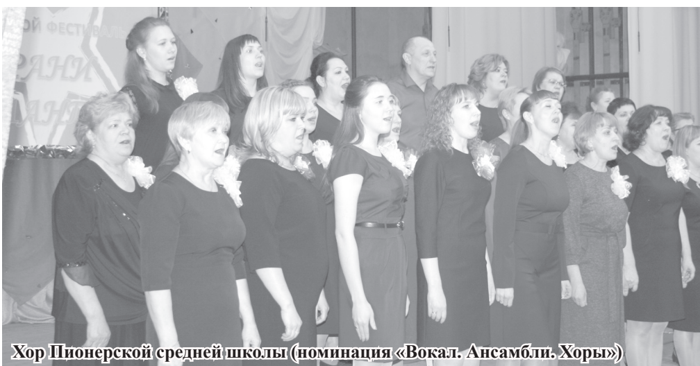
Хор Пионерской средней школы (номинация «Вокал. Ансамбли. Хоры»)