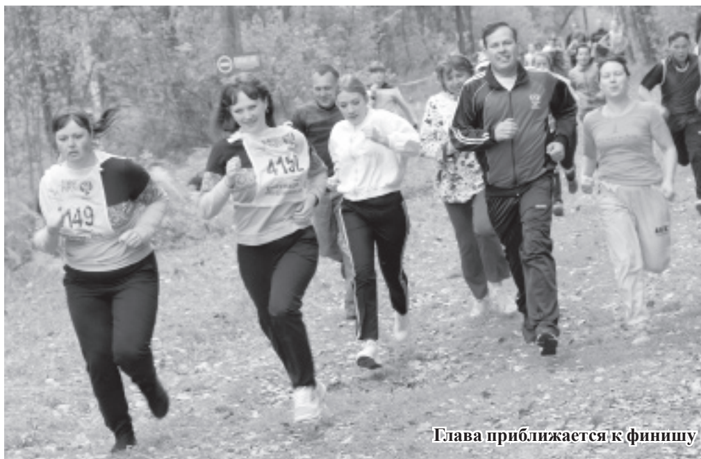
Глава приближается к финишу