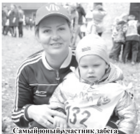
Самый юный участник забега

демонстрировать свои физические способности.