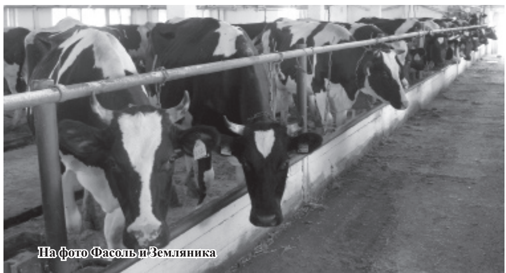
На фото Фасоль и Земляника

Сегодня в хозяйстве Балакина С.М. порядка 1080 голов крупного рогатого скота.